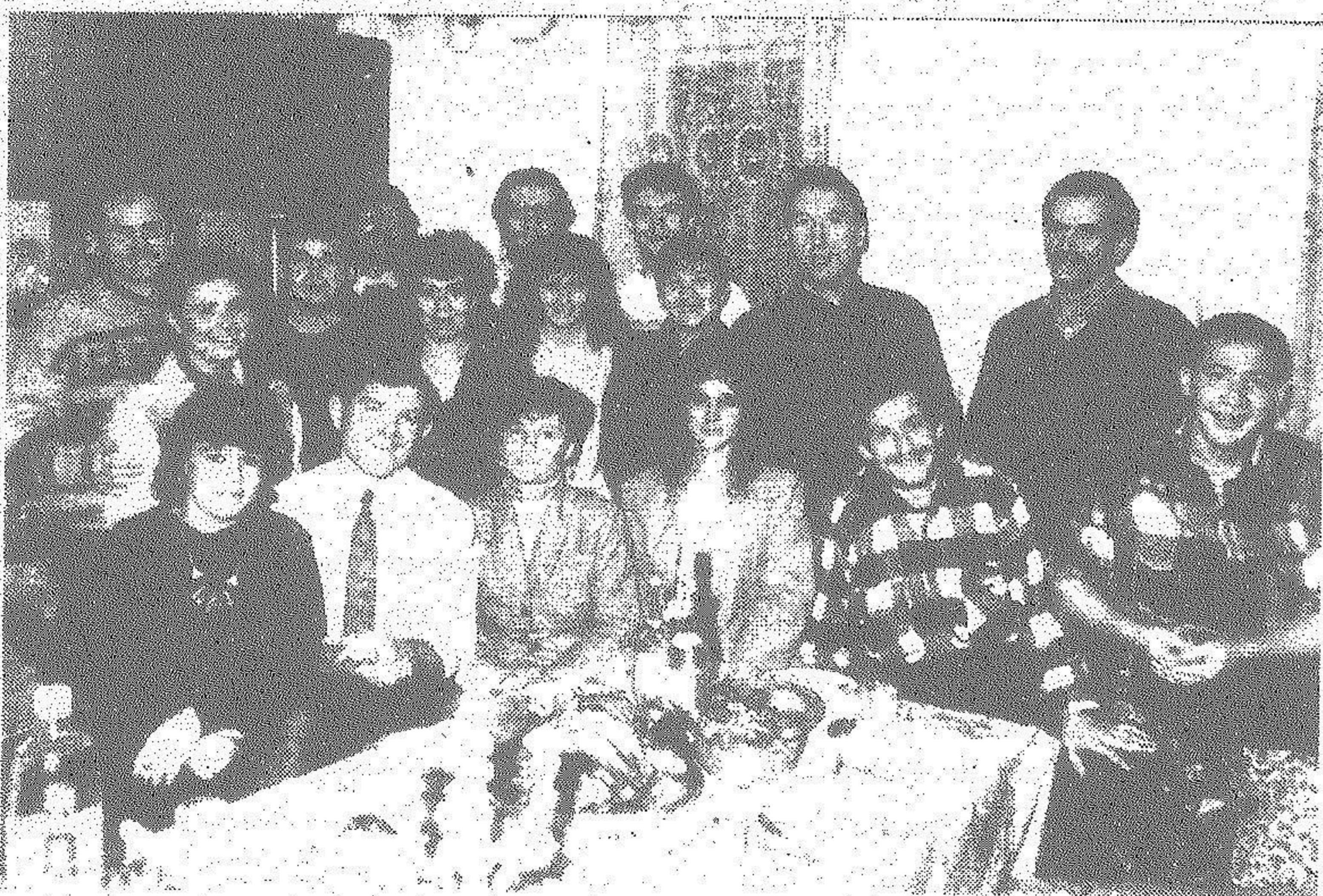
На фото: участники встречи